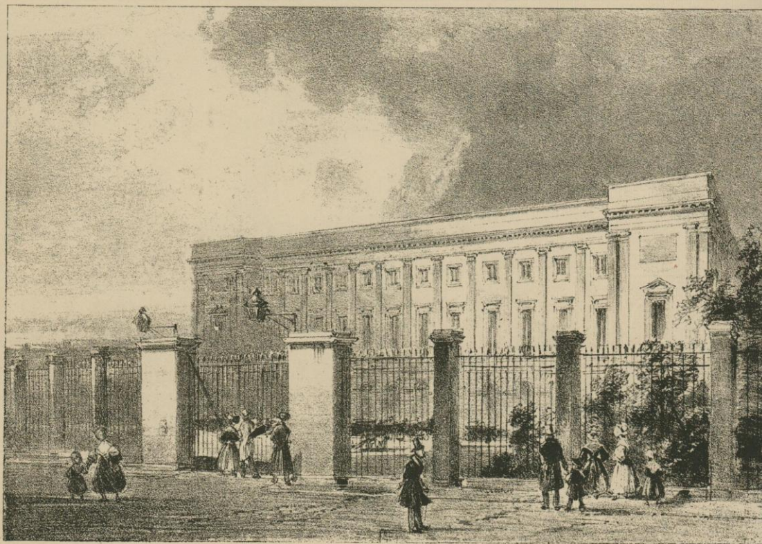
LE PALAIS DU PRINCE D'ORANGE. Fac-simile de la lithographie de Fourmois.

décrété que « pour honorer la mémoire des Belges qui ont contribué à illustrer la patrie, et excité tout à la fois une noble émulation parmi les statuaires les plus distingués du pays en les appelant à un travail national », le ministre de l'intérieur était autorisé à « faire exécuter, par des artistes belges, les statues des grands hommes de la Belgique ». Comme nous venons de le dire, la mémoire de Vésale